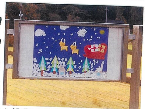
▲ 今月の掲示物 (綾部ティサービスセンター)